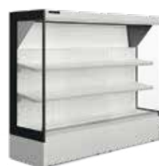
Frutas & Legumes Fresh Produce