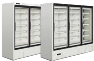
Alimentos congelados Frozen foods Portas convencionais / Portas Full Vision Conventional glass doors / Full Vision glass doors