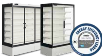
Alimentos refrigerados Chilled foods Portas convencionais / Portas Full Vision Conventional glass doors / Full Vision glass doors