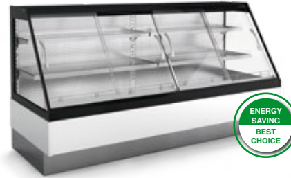
SM HF2 CP H13/15 com portas frontais em vidro duplo with double-glazed glass doors