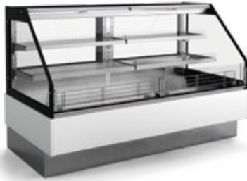
SM HF2 CC com costas panorâmicas with see-through back