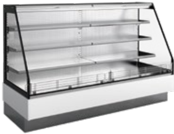
SM HF2 CC com costas em inox with stainless steel back